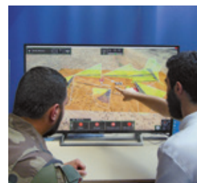
Audit et identification des vulnérabilités

Cette confrontation menaces/protections aide à identifier les vulnérabilités. Nos procédures garantissent la protection des informations sensibles du site.